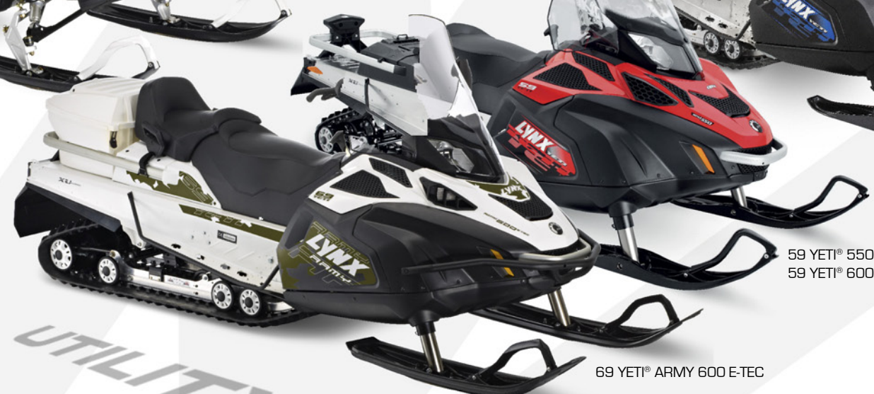
69 YETI® ARMY 600 E-TEC