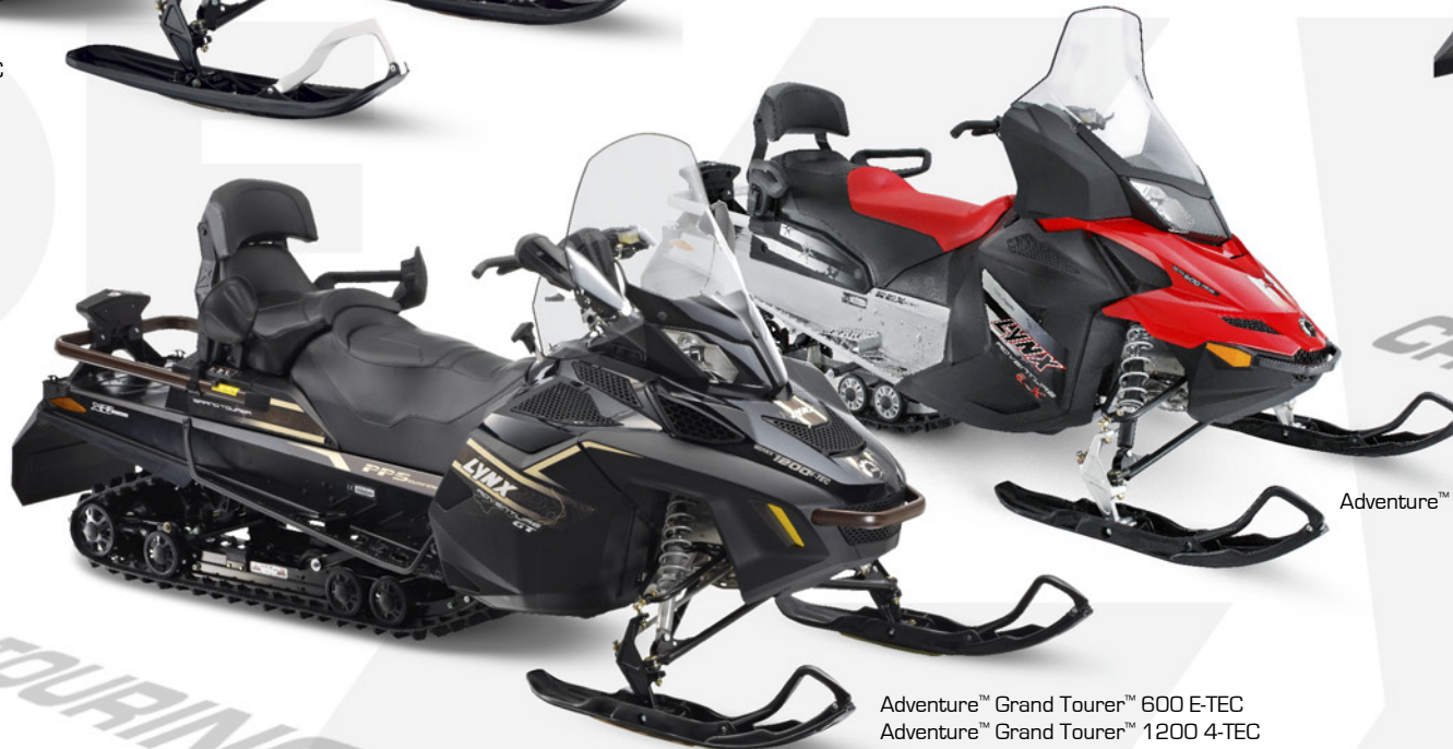
Adventure™ LX 600 ACE