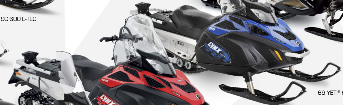
59 YETI® 550 59 YETI® 600 ACE